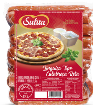
Calabresa Reta 2,5kg